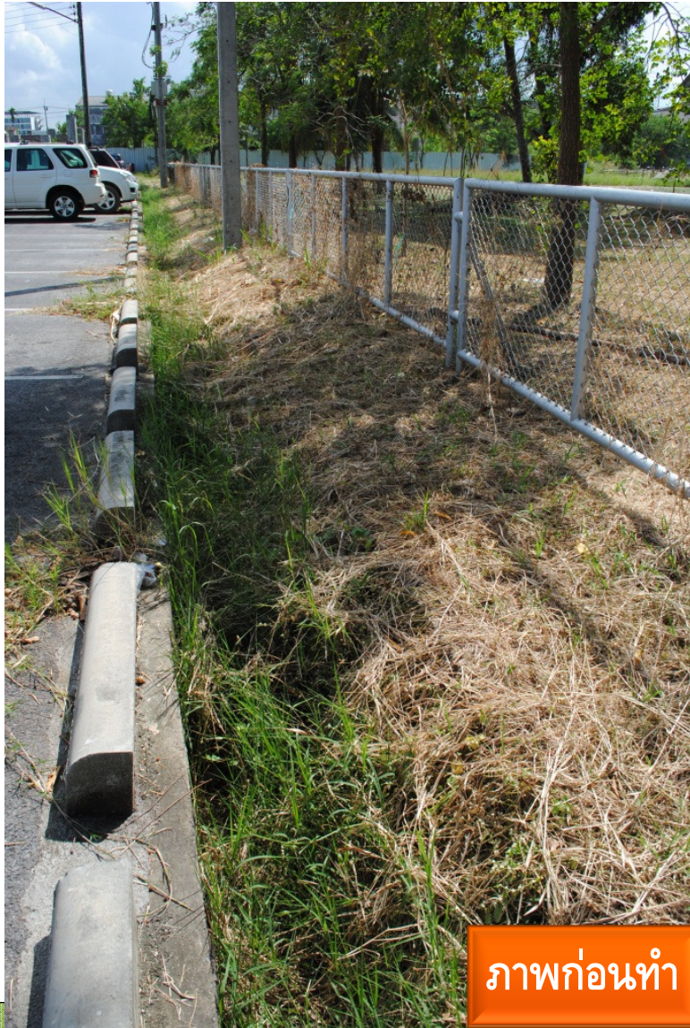
ภาพก่อนทำ