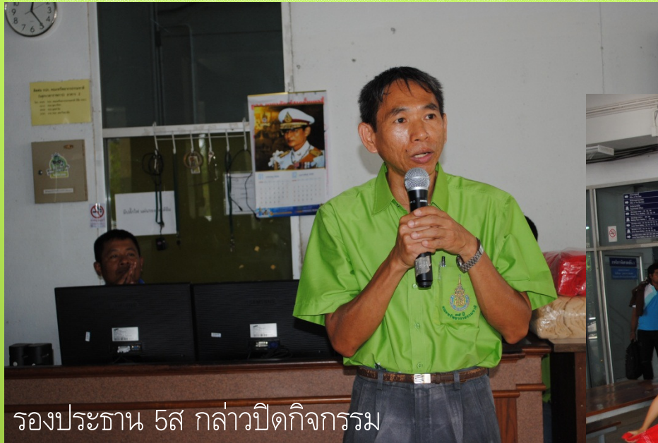
รองประธาน 5ส กล่าวปิดกิจกรรม