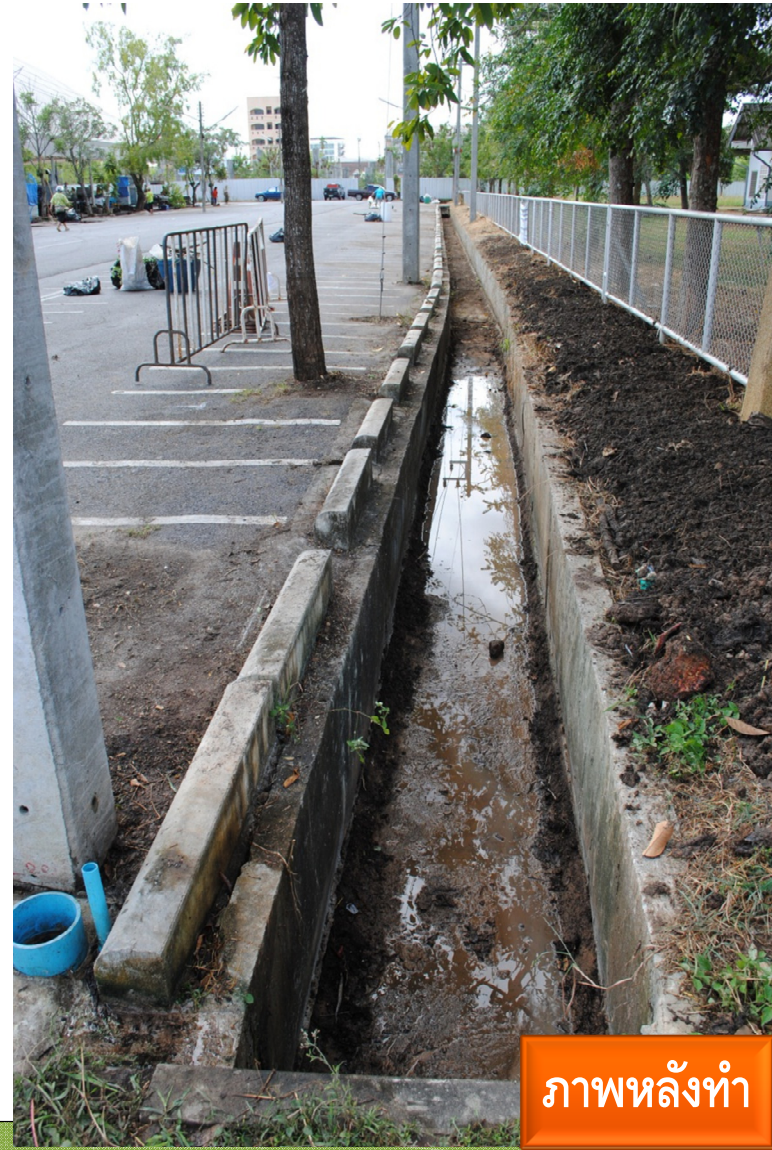
ภาพหลังทำ