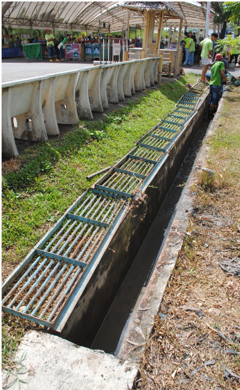
Big Cleaning Day 7 Feb 2013