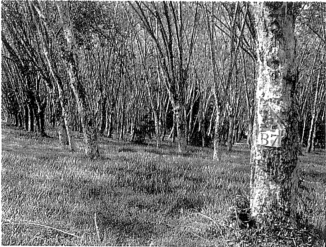
ภาพแปลงยาง D3