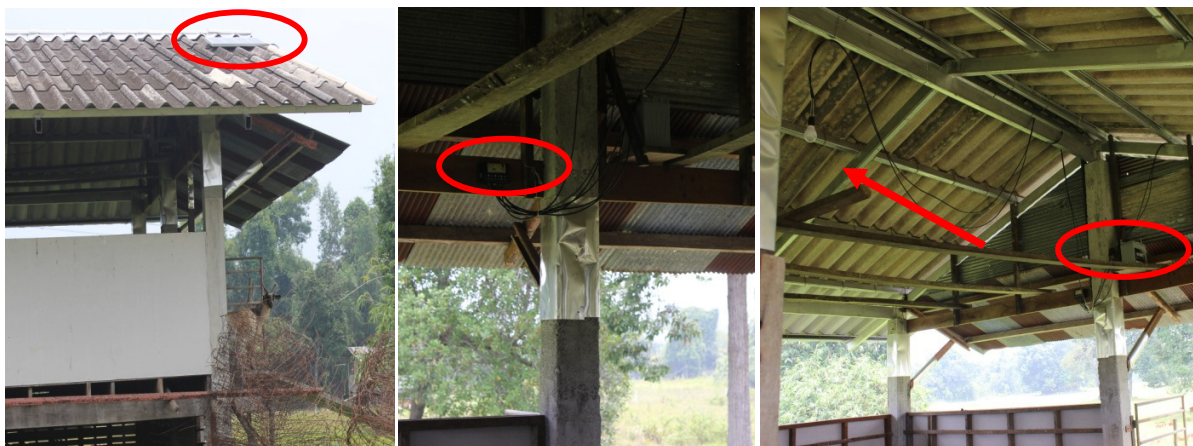
ภาพที่ 6 การติดตั้งแผงโซลาร์และหลอด LED ในโรงเรือนเลี้ยงแพะ

สืบเนื่องจากการไม่มีระบบแสงสว่าง จึงทำให้ง่ายต่อการเข้าออกพื้นที่ในช่วงเวลากลางคืน ซึ่งในเดือนสิงหาคม พ.ศ. 2558 ศูนย์ฯ ได้ทำการติดตั้งระบบแผงโซลาร์และหลอด LED ในโรงเรือนเลี้ยงแพะจำนวน 2 หลัง (ดังแสดงในภาพที่ 6) และในปีงบประมาณ พ.ศ. 2559 ศูนย์ฯ จะดำเนินการติดตั้งในโรงเรือนที่ตั้งอยู่ในพื้นที่เลี้ยงอีก 2 โรงเรือน นอกจากนี้ศูนย์ฯ ยังจัดให้มีเจ้าหน้าที่คนงานนอนพักภายในเพื่อดูแลสำนักงานของศูนย์ฯ ในช่วงกลางคืนด้วย