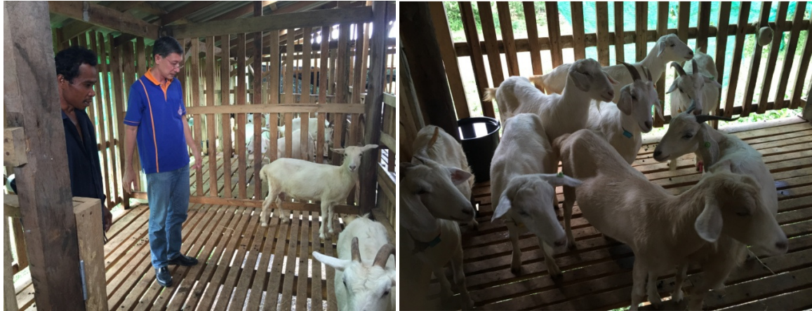
ภาพที่ 5 การลงพื้นที่เพื่อให้คำแนะนำการเลี้ยงแพะแก่โครงการ

10.5 สนับสนุนความรู้ทางวิชาการด้านการเลี้ยงแพะแก่โครงการส่งเสริมอาชีพเลี้ยงแพะของโครงการ คณะทำงานโครงการพระราชดำรินในสมเด็จพระนางเจ้าสิริกิติ์พระบรมราชินีนาถ ที่ 3 ณ บ้านไอร์บือเต ตำบล ช้างเผือก อำเภोजะเเนะ จังหวัดนราธิวาส