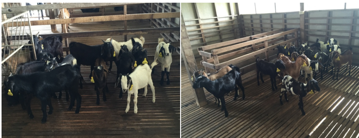
ภาพที่ 4 ตัวอย่างลูกแพะลูกผสมแบล็คเบงกอลที่เตรียมการส่งมอบให้แก่มูลนิธิชัยพัฒนา

10.4 สนับสนุนงานของมูลนิธิชัยพัฒนาในการผลิตแพะลูกผสมแบล็คเบงกอลสำหรับแจกจ่ายให้แก่ราษฎรในจังหวัดสตูล (พระราชประสงค์ของสมเด็จพระเทพรัตนราชสุดาฯ) ทั้งนี้ปัจจุบันศูนย์ฯ มีลูกแพะที่จะถวายสมเด็จพระเทพรัตนราชสุดาฯ จำนวน 33 ตัว ดังแสดงในภาพที่ 3