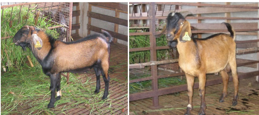
ภาพที่ 2 แพะเนื้อลูกผสมทรัพย์-ม.อ. 1 ที่พัฒนาโดยศูนย์ฯ ตามนโยบายของคณะทรัพยากรธรรมชาติ

10.1 ผลิตแพะเนื้อและแพะนมสายพันธุ์ของคณะทรัพยากรธรรมชาติ (ดังแสดงในภาพที่ 1) มหาวิทยาลัยสงขลานครินทร์ เพื่อสนับสนุนภารกิจการเรียนการสอน การวิจัย และการบริการวิชาการ รวมทั้งสนับสนุนภารกิจของสถาบันชาลาลในการผลิตแพะเนื้อและนมแพะชาลาลรองรับความต้องการของจังหวัดชายแดนภาคใต้