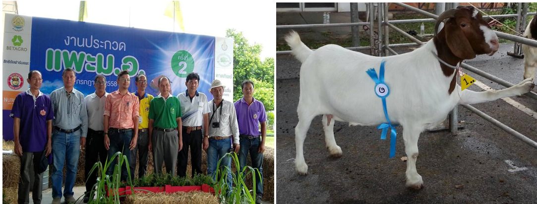
ภาพที่ 3 กิจกรรมการประกวดแพะ ม.อ. ครั้งที่ 2 เมื่อวันที่ 29 กรกฎาคม 2558

10.3 จัดกิจกรรมการประกวดแพะเนื้อจำนวน 1 ครั้ง เมื่อวันที่ 29 เดือน กรกฎาคม พ.ศ. 2558 ดังแสดงในภาพที่ 2